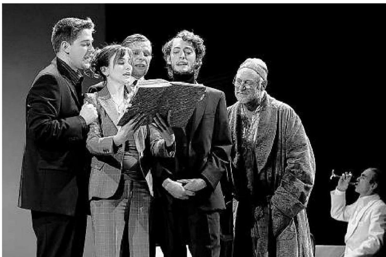
Eigenwillige Feier: In «Ebenda – Ein Gedächtnistheater» wird auf Albrecht von Hallers Lebens zurückgeblickt.