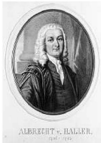
Universalgelehrter: Albrecht von Haller, dargestellt auf einem Pastellbild von 1865.

zeigt sich auch in einem Besuch von Kaiser Josef II. in Bern im Sommer 1777. Der Kaiser ahnte den baldigen Tod und bedauerte, «dass der Verlust dieses grossen Mannes so nah ist». Haller starb am 12. Dezember 1777 im Alter von 69 Jahren.