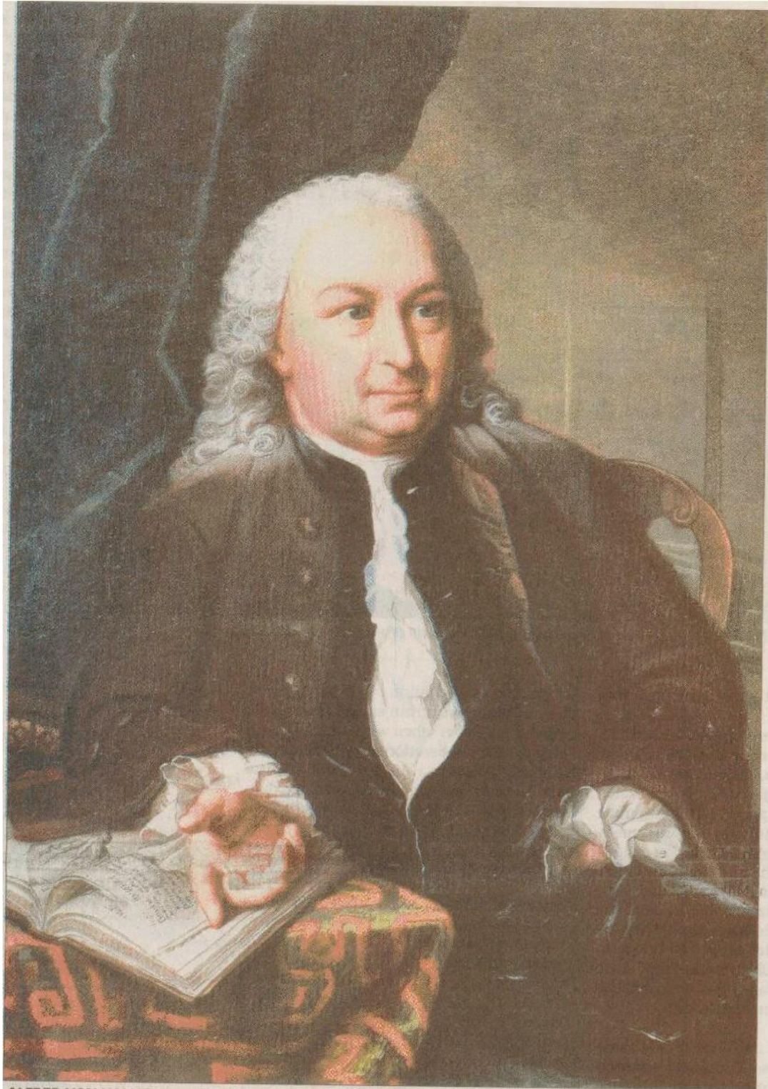
ALFRED VON HALLER Der Botaniker beschrieb hunderte von Schweizer Pflanzen. BÜRGERBIBLIOTHEK BERN