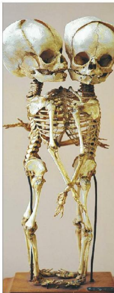
SEZIERT Albrecht von Haller präparierte diese siamesischen Zwillinge.