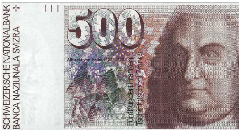
BEKANNT In dieser Form – auf der alten 500er-Note – ist von Haller wohl den meisten in Erinnerung.